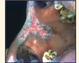
සුදු හා රතු මිශ්‍ර ලප